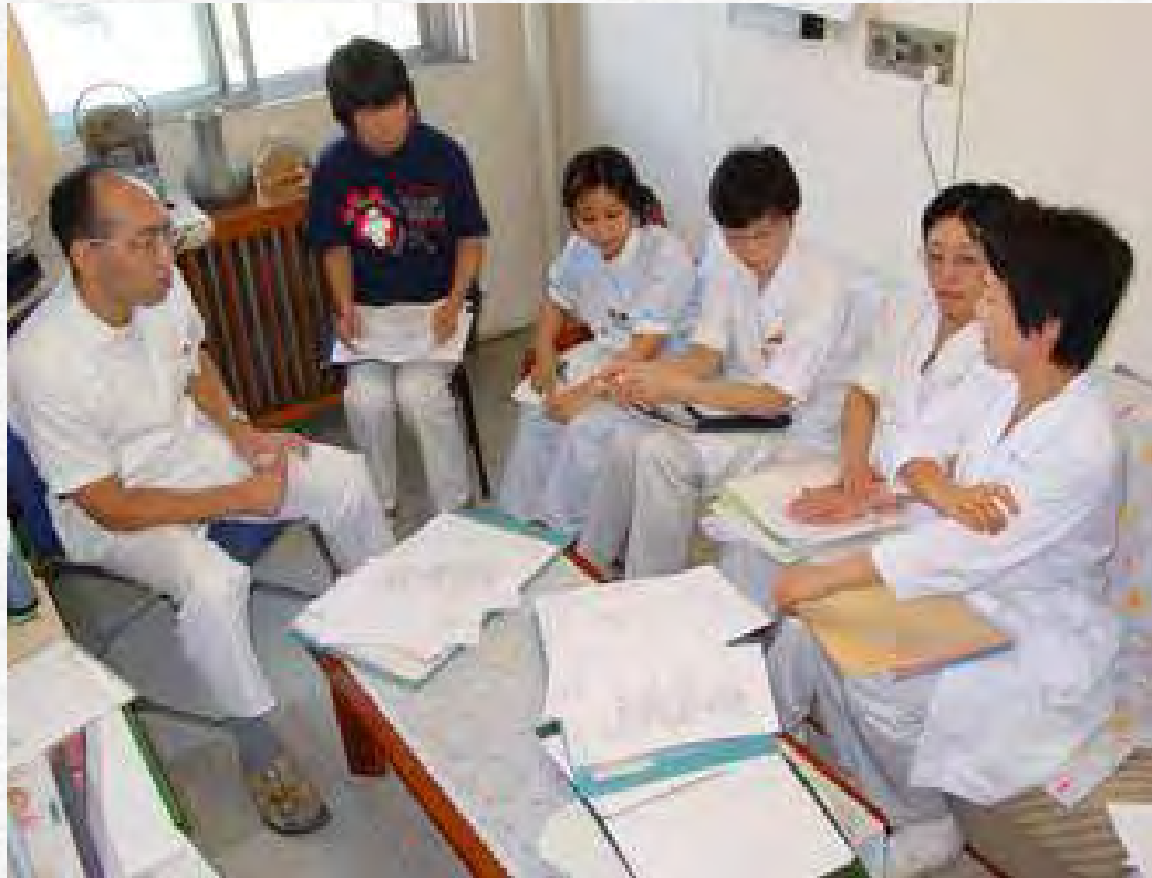
NSTカンファレンスの様子